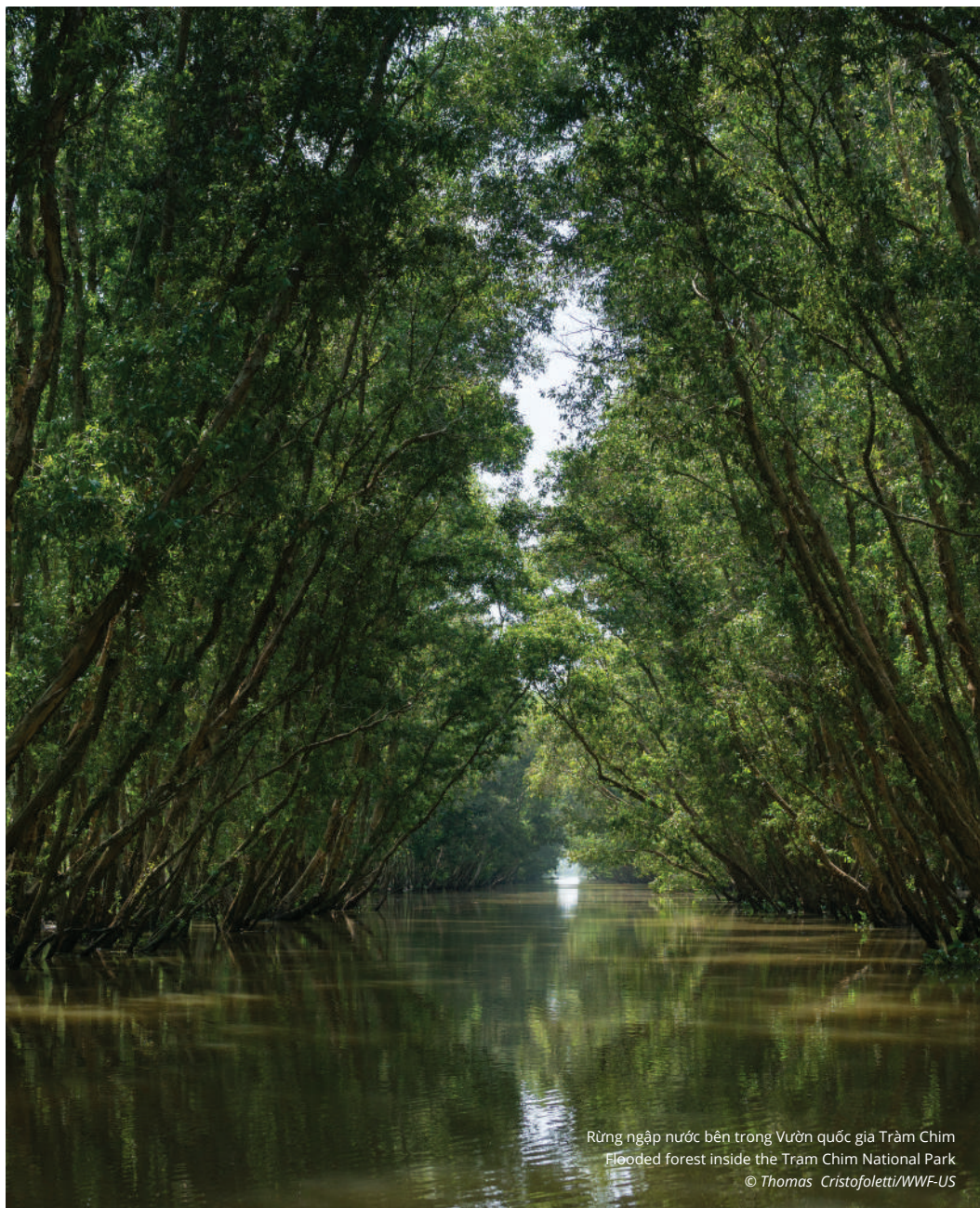
Rừng ngập nước bên trong Vườn quốc gia Tràm Chim Flooded forest inside the Tràm Chim National Park